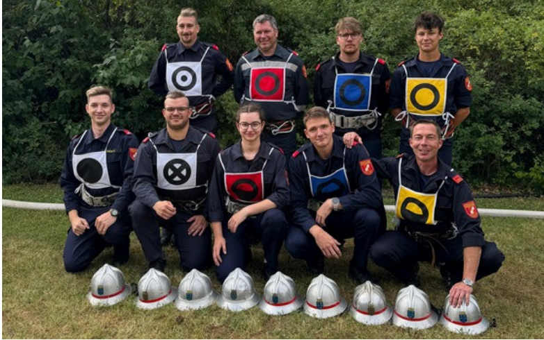
Landesfeuerwehr- leistungsbewerbe in Schwechat