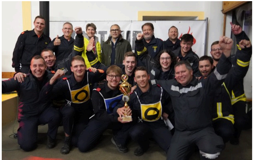
Kuppelcup in Kattau