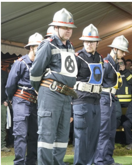
Gruppe Mühlfeld 1 → Sieger mit 25,49 Sekunden + 0 Fehlerpunkten